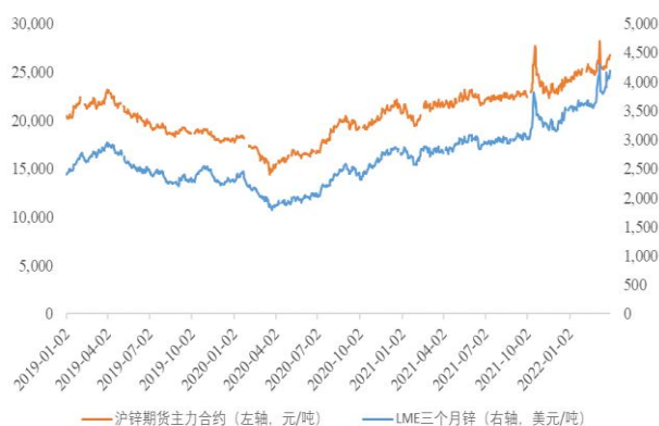
图 1：近年来 LME3 月期锌及 SHFE 锌主力合约价格

2022 年 2 月以来受俄乌战争影响，能源价格推动大宗商品市场价格上涨，锌价屡创新高。2022 年 3 月末，LME 三月期锌收于 4,174 美元/吨，3 月均价为 3,969 美元/吨，同比上涨 41.61%；同期末沪锌主力合约收于 26,785 元/吨，3 月均价为 25,985 元/吨，同比上涨 20.47%。铅价整体呈外强内弱态势，2022 年 3 月末，LME 三月期铅收于 2,392 美元/吨，3 月均价为 2,353 美元/吨，同比上涨 19.2%；同期末沪铅主力合约收于 15,815 元/吨，3 月均价 15,429 元/吨，同比上升 2.6%。